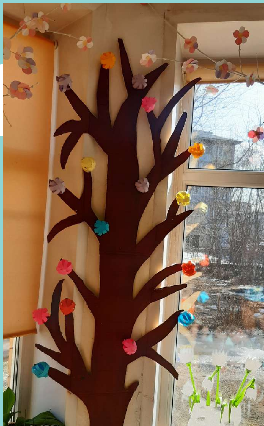
"Вырастили" дерево радости